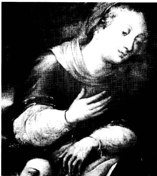
Santa Ana en el nacimiento de la Virgen de Juan Correa (detalle).

cativo. Así manifestaba Díaz de León que el programa del Asilo de Mendigos era “corregir, moralizar y educar a los indigentes”, 54 de tal manera que, la enseñanza en el asilo no era solamente pragmática, a través del aprendizaje de un oficio ajustado a su aptitud o apropiado a su género, sino que les enseñaba a mantener aseado su cuerpo y su ropa; también se les daba instrucción moral y religiosa y se fomentaban principios de solidaridad (a través de la ayuda de los mendigos hacia los incapacitados y apoyando las tareas del servicio doméstico del asi-