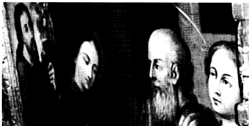
Detalle de “La visitación de Juan Correa”.

Por las razones expuestas, los filántropos se propusieron rescatar al mendigo y dejar en manos de la justicia el destino de los “seres degradados y de malos sentimientos” o sea, los vagos criminales. 22 Las