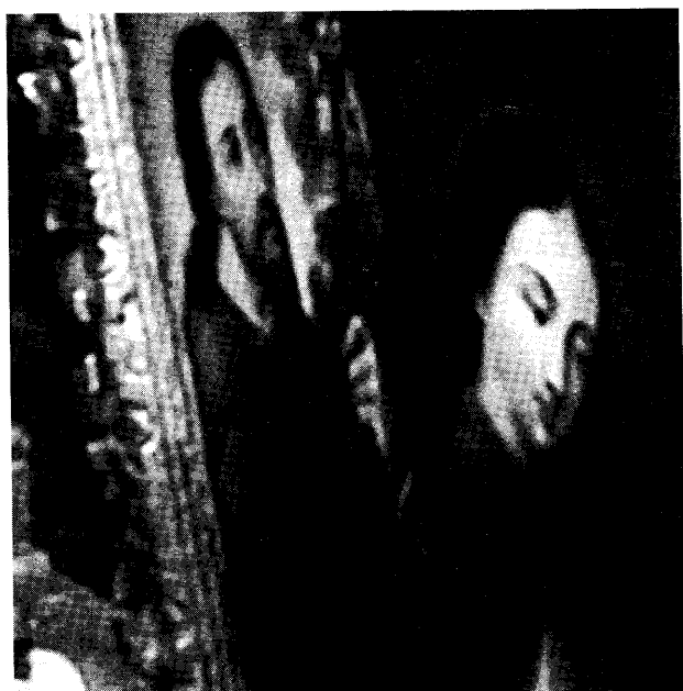
San José y la Virgen (detalle).