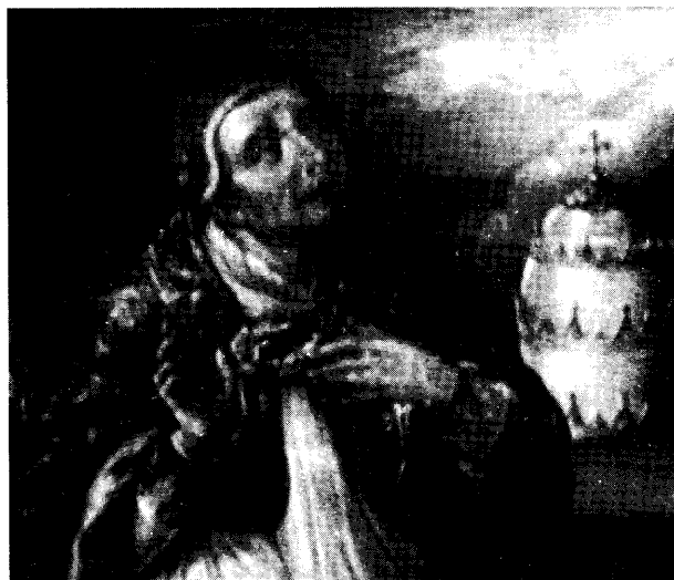
San Gregorio (detalle).

bía auspiciarse en el México porfiriano de acuerdo con los requerimientos de una sociedad moderna, ilustrada y liberal. “El esfuerzo reformista iba acompañado de una nueva concepción del modelo y del tipo de hombre que debía forjarse después de tener la certidumbre de su regeneración”. En el centro de esta idea estaba el individuo quien tenía obligaciones y deberes para con la sociedad. La clave de su aceptación sería que tuviese un trabajo honesto: “...educación y religión, serían las bases de la metamorfosis que los sacaría de la degradación, la miseria y el vicio”. 66